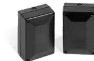
FOTOCÉLULAS EXTERIORES MF3