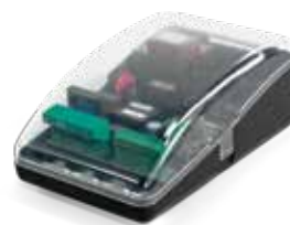
CENTRAL ELETRÔNICA MC15