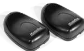
FOTOCÉLULAS EXTERIORES MF1