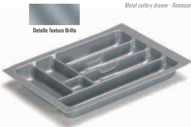
Metal cutlery drawer - Ramasse couverts tiroir metalique

Para módulos melamina de 16 mm. Para cajón metálico de 500 mm. de fondo. Opcional para fondo de 450 mm.