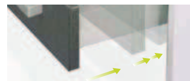
Self-closing for metal lateral and wood drawer / Fermeture automatique pour letéral métallique et tiroir en bois

El kit se compone de dos mecanismos (derecha e izquierda) y de pins para cajón de madera y lateral de chapa.